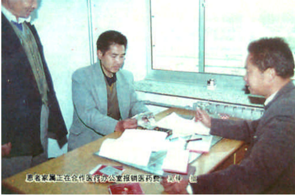
患者家属正在合作医疗办公室报销医药费

广饶县大王镇现有51个村子,农业人口4.94万人。虽说这里是年创产值超过50亿元的鲁北经济强镇,可农民群众在治病治疗方面仍然不同程度地存在这样那样的困难和不足。为了从根本上解决当地农民群众和乡镇企业职工家庭可能出现的因病致贫、因病返贫的问题,保证社会经济发展不受这些方面因素的影响,这个镇从1999年1月1日开始启动合作医疗。由市财政每年投入5万元,镇财政每年投入4.97万元,村民按上年人均纯收入的0.5%,每人每年交纳11元左右,形成合作医疗基金,用于解决当地群众的就医住院问题。合作医疗的启动,在当地群众当中引起了强烈反响,大家积极报名参加